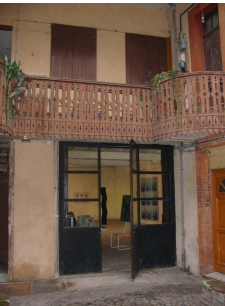
galerie Jacques Girard 20, rue des Blanchers Toulouse 1982-2012

Les erreurs factuelles, ou les omissions, n'engagent que les auteurs des textes.