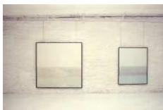
exposition Piet Moget galerie Jacques Girard, décembre 1984